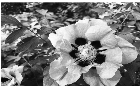
本期责任编辑：邹文勇 罗文波